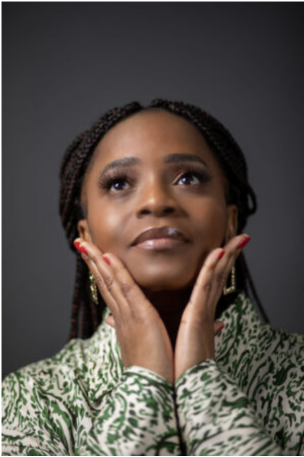
M'PASSI le 19/06/2023